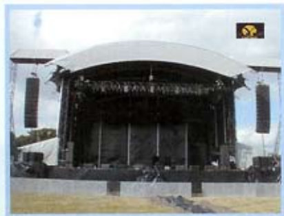
Graspop Festival (Bélgica)