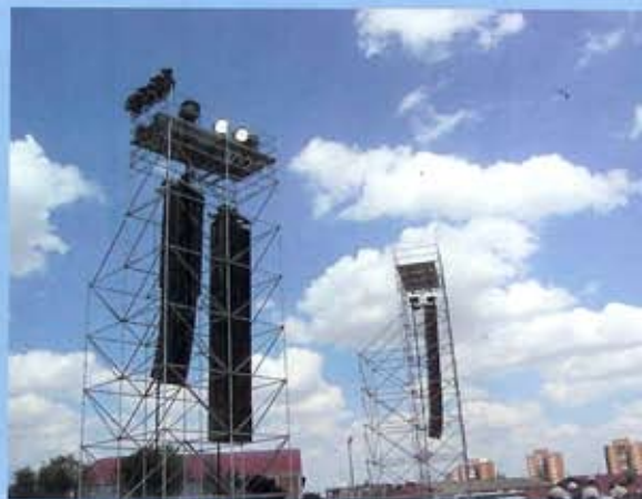
Visita Juan Pablo II (Madrid)

etc.) y de la horizontal, disponemos también de una gráfica mecánica, donde vemos el perfil del array, con sus ángulos y su peso.