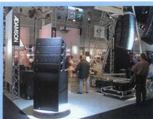
4 Spek-Trix + 2 Subs (SIEL)