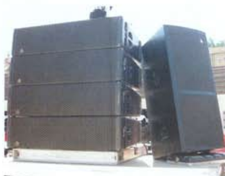
Stack de 4 Y-10 + SX-18. "Carmen" Stade de France.