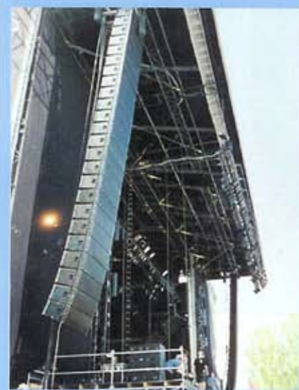
48 Y-18 Iron Maiden. Strasbourg

frame (soporte principal de aluminio de donde se cuelgan las cajas), etc...o nos dice la mejor forma de colocar el material de que disponemos, viendo si es suficiente o no, así como nos da una visión horizontal donde leemos la cobertura con indicación de la presión que tenemos en cada punto. Haremos el cálculo predefiniendo también la posición del público, sentados o de pie, y predeterminando un tipo de presión deseable, entre : low spl, classic jazz, rock variety, high spl, very high spl. Además de la visión vertical (altura de escenario, gradas, motores, frame,