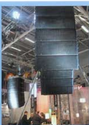
5 Y-18 + 3 Y-10 (SIEL)

des de algunas empresas afortunadas que dispusieron de ellas mientras se retocaban algunos parámetros, fue como decimos en el SIEL la presentación oficial, con los dos subs que permiten una posición opuesta entre ellos para obtener un patrón cardioide. Este equipo, sónicamente excepcional, volado tiene un comportamiento excelente, pero ofrece además la posibilidad de usarse apilado desde el suelo del escenario o las alas del mismo, siendo una solución perfecta en tantos casos como nos encontramos en que nos es imposible colgar, sea por falta de medios en los espacios o por otras causas.